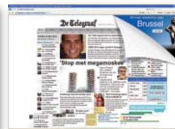
Gallery premium display advertising: corner ad, stedentrip.nl