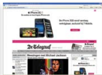
Gallery premium display advertising: pushdown, I-phone