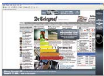
Gallery premium display advertising: hockeystick, Hyundai