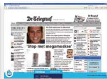
Gallery premium display advertising: floor ad, ComedyCentral