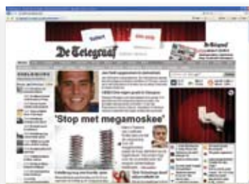
Gallery premium display advertising: flyover, Telfort